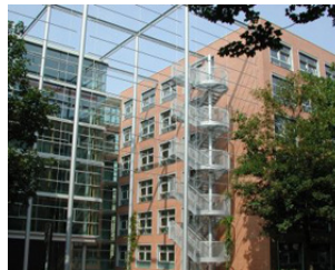
GWZ BEETHOVENSTRASSE 15 04107 LEIPZIG