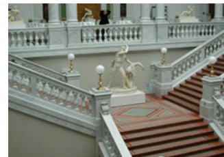
BIBLIOTHECA ALBERTINA BEETHOVENSTRASSE 6 04107 LEIPZIG